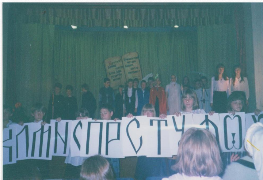
Городской спектакль «Радуйтесь, Словенских стран апостолы!»