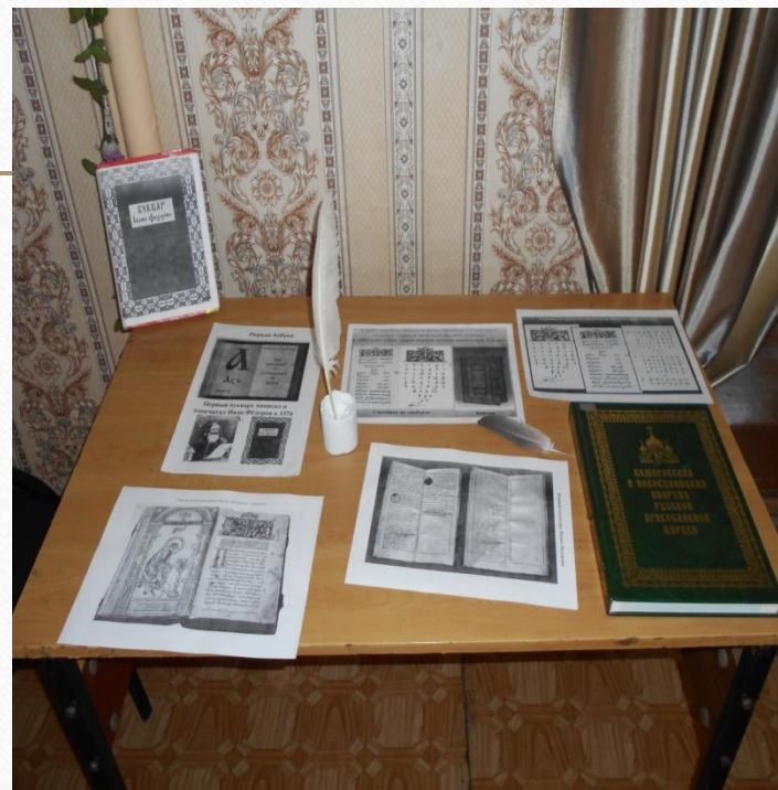
Копии страниц древних книг