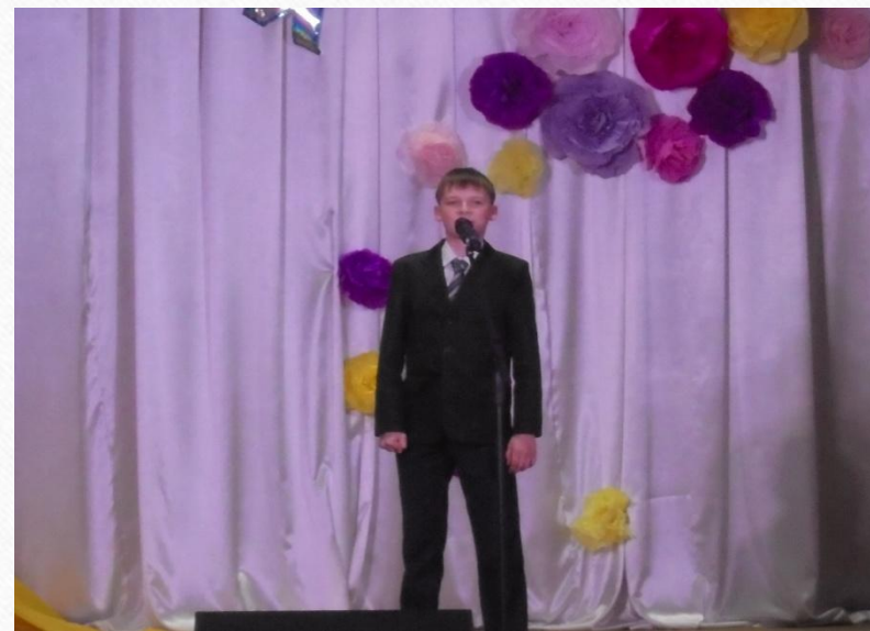
Городской конкурс чтецов в честь Дня славянской письменности и культуры